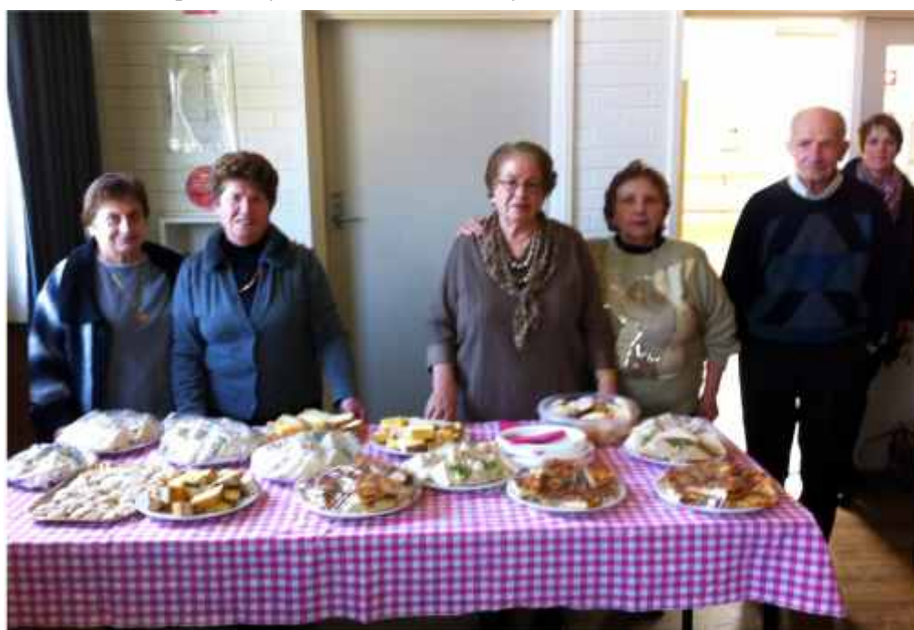
Circolo Pensionati di Mordialloc

□ Collaboration with the Centre for Culture, Ethnicity and Health (CEH) in the conduct of research into the utilisation of interpreters by the Italian community. This