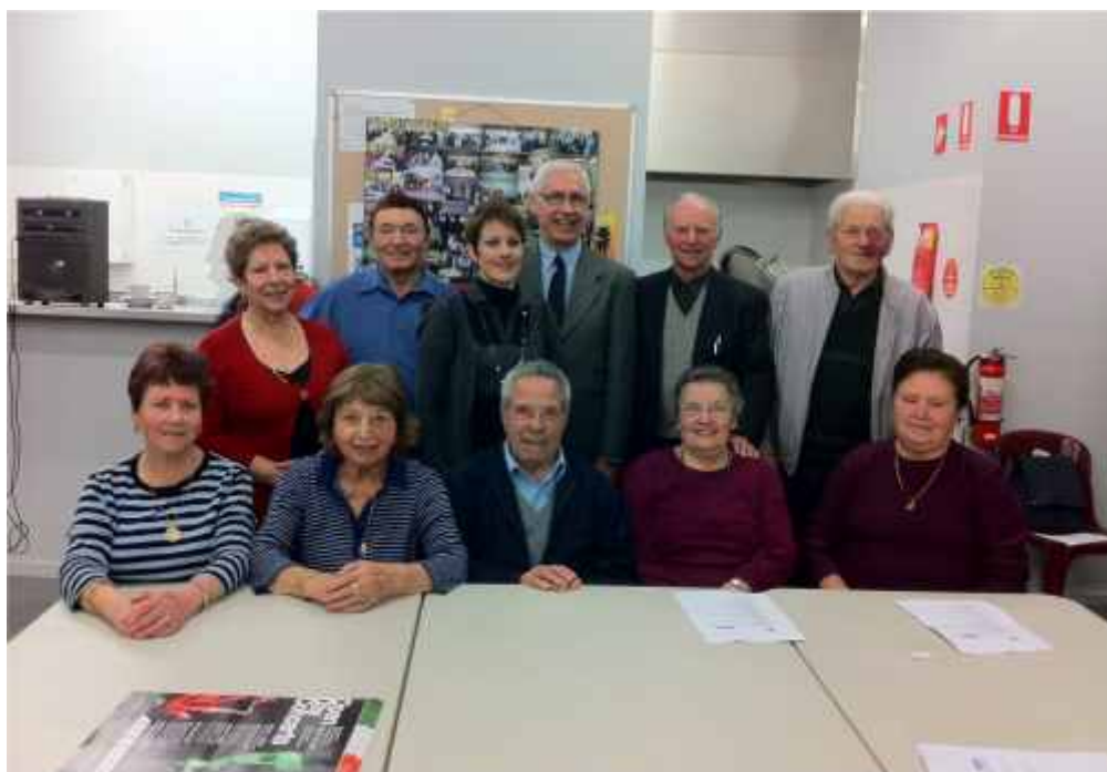
Circolo Pensionati di Nunawading / Box Hill