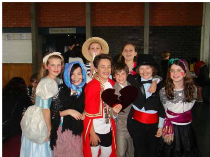
Participants at the annual Performing Arts Competition

Il concorso di Poesia del Distretto Est organizzato in collaborazione con il network degli insegnanti della scuola primaria, ha dimostrato ampiamente le abilità e l'entusiasmo degli alunni verso la lingua italiana.