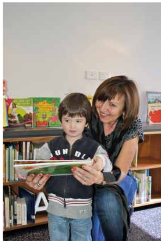
Sharing literature at the Resource Centre

Uploaded on the Co.As.It. website once a term is “ Il Centro ”, the official newsletter of the Centre. Apart from providing teachers with cultural material, and general information, including new resources, it details professional development and other events available to teachers and students. Regular emails are also a vital source of contact between the Resource Centre and teachers, students and the general public. Information can be distributed almost instantly providing a very effective channel of communication.