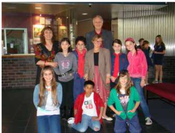
Participants at the annual Performing Arts Competition

Durante l'anno sono state organizzate varie iniziative per gli studenti di italiano delle scuole di vario livello. Più di 400 studenti del VCE (maturità) si sono registrati per i due giorni di workshop in preparazione per l'esame di maturità; l'iniziativa si è tenuta durante le vacanze. Una 'prova dell'esame di maturità (VCE)' è stata preparata per gli studenti e mandata a più di 80 scuole nello stato del Victoria. In collaborazione con la VATI, anche quest'anno è stata organizzata la Italian Performing Arts Competition presso il Darebin Arts and Entertainment Centre, sia per le scuole primarie che secondarie. L'iniziativa ha riscosso un notevole successo. Circa 200 studenti provenienti da 20 scuole hanno recitato in piccoli spettacoli scritti da loro stessi in collaborazione con gli insegnanti. La giornata è stato un'occasione molto importante per promuovere l'insegnamento e l'apprendimento dell'italiano nelle rispettive scuole. Centinaia di studenti hanno visitato il Museo Italiano ed hanno partecipato alle attività linguistiche preparate dai Co.As.It. Education Officers.