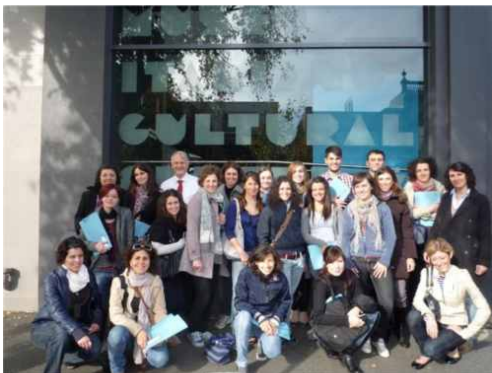
2011 Language Assistants

Si continuano a svolgere i concorsi di poesia LOTE ed il LOTE Primary Camp per promuovere l'apprendimento dell'italiano nella zona. Questi eventi hanno riscosso notevole successo presso gli studenti, le scuole, i genitori e gli insegnanti di italiano che vi hanno preso parte.