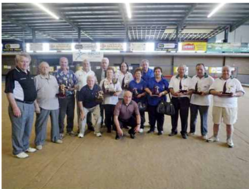
Tutti i finalisti del Torneo di Bocce

The bimonthly meetings were also important, as usual, to face and discuss themes connected with the condition of the elderly in today's society. At these meetings, we were able to invite experts and consultants from organisations which operate in the fields of health care and social and welfare services. From this point of view, the network of clubs is, for Co.As.It., both a way to reach the community and to provide assistance, and an important tool for monitoring the evolution of the social needs of our ageing population.