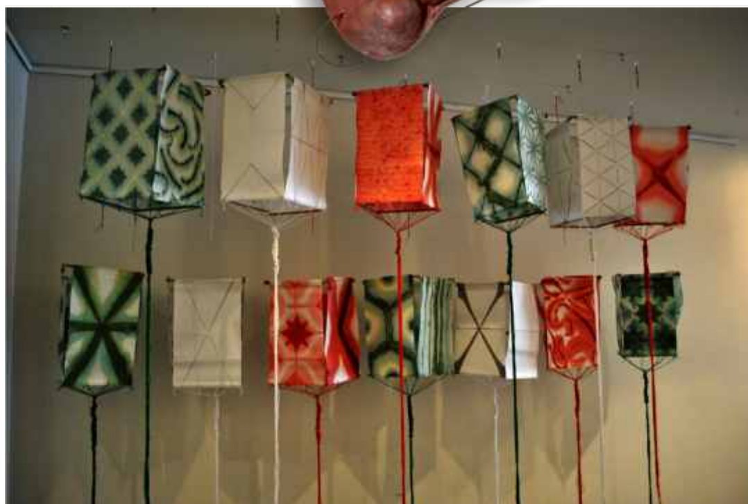
Lantern Exhibition 2011