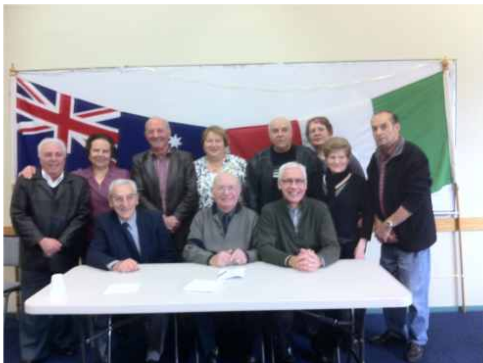
Circolo Pensionati di Greenvale

I prossimi 12 mesi saranno, per l'addetto e per il progetto, un periodo di transizione dovuta alla transizione del progetto alla fase successiva, caratterizzata da un nuovo ruolo addetto all'accesso e sostegno (Access and Support role) nel contesto della pianificazione e pratica della HACC per la diversità (HACC Diversity Planning and Practice).