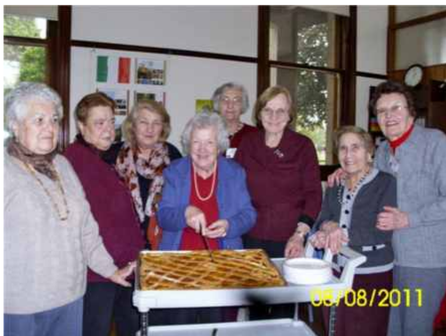
Clients showing their crostata with cumquat marmalade at Rosanna

The Rosanna group, like the other Co.As.It. Day Centres, provides a quality service to meet the social and recreational needs of elderly Italians in a way that is culturally appropriate.