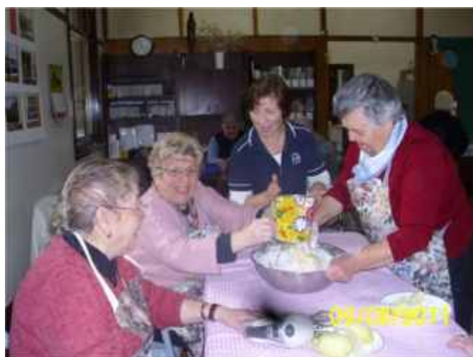
Activities where the clients can share their recipes and keep their minds active

The next twelve months will be a period of transition for the worker and the project, as the project moves to the next stage, that is, the new Access and Support role in the context of the HACC Diversity Planning and Practice.